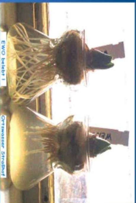
Bulbes de jacinthes, après env. 1 mois. A gauche: vitalisé, à droite sans EWO