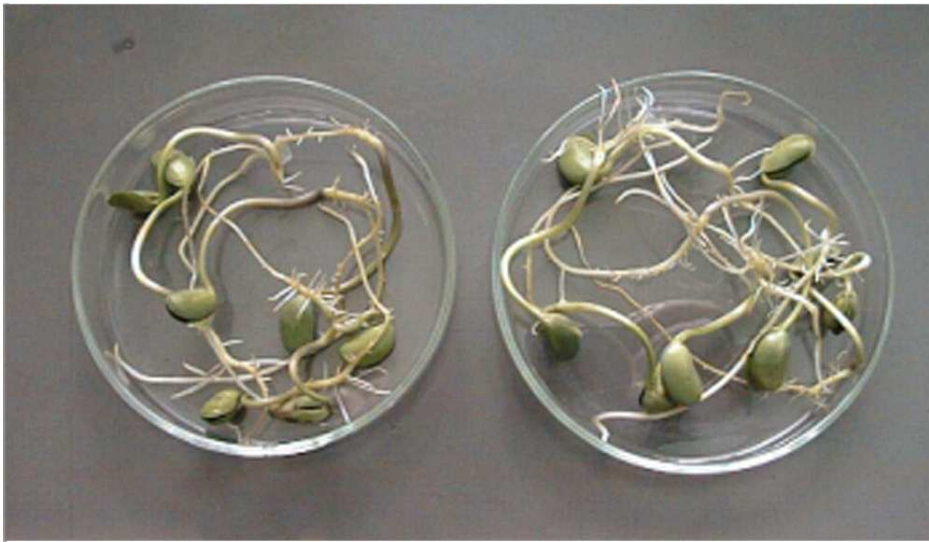
Exemple avec des graines de soja germées après 5 jours de culture. A gauche, arrosées à l'eau du réseau sans traitement A droite, arrosées avec de l'eau vitalisée EWO