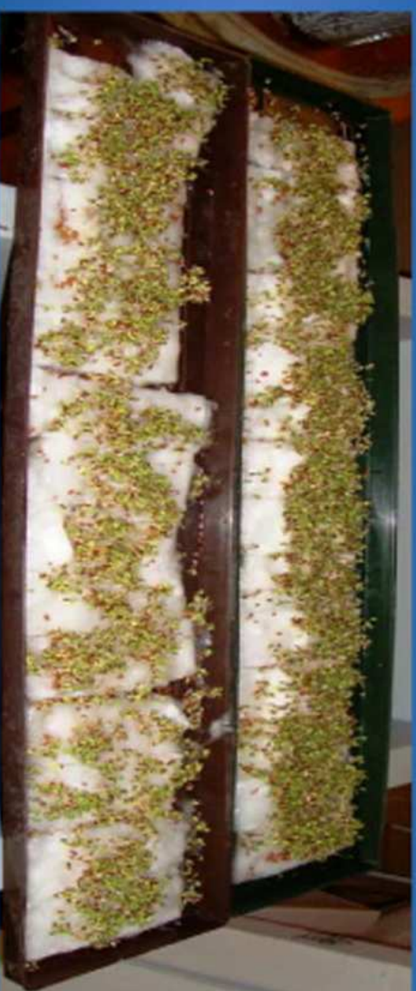
A l'arrière du cresson arrosé avec de l'eau EWO, à l'avant avec de l'eau ordinaire